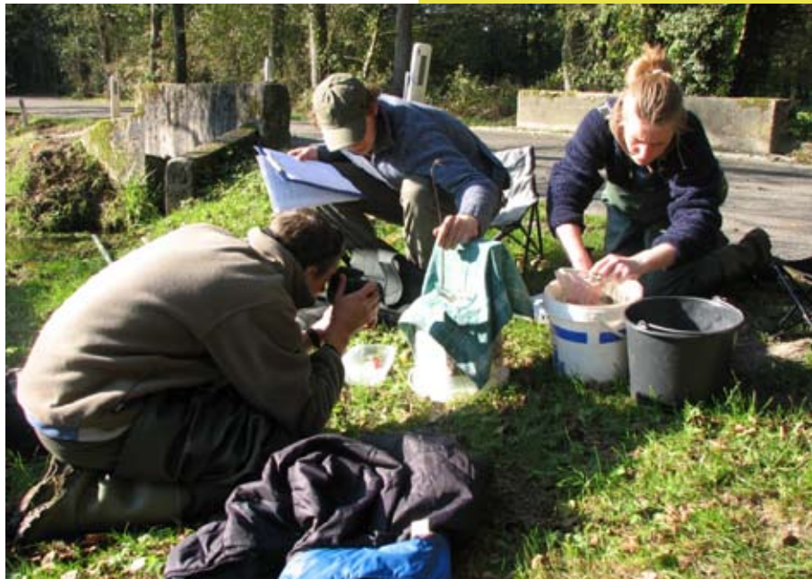
Donderpadonderzoek Hierdensch beek