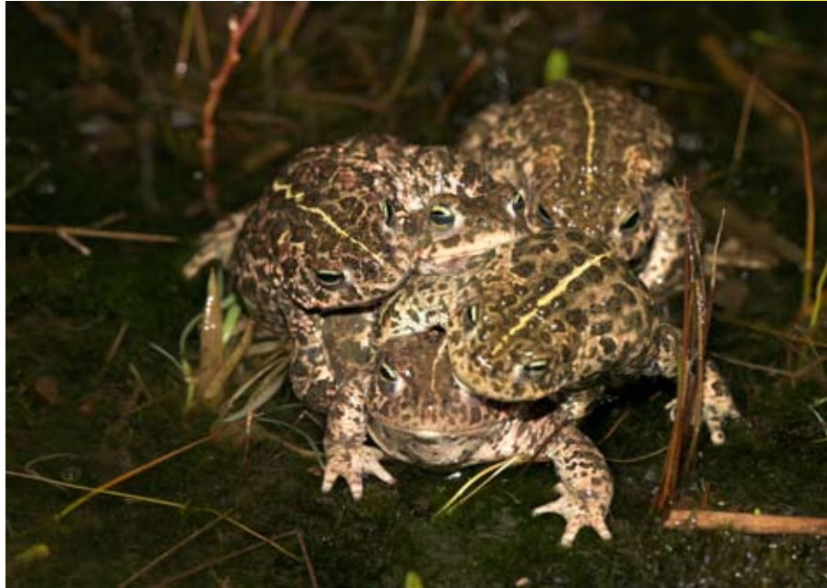
Rugstreeppadmannen in actie

Hoe de verspreiding van beide soorten in Nederland precies ligt, wordt in opdracht van het ministerie van LNV onderzocht. Het onderzoek voert RAVON samen met bureau Natuurbalans-Limes Divergens uit. In samenwerking met de universiteit van Berlijn worden er genetische analyses uitgevoerd.