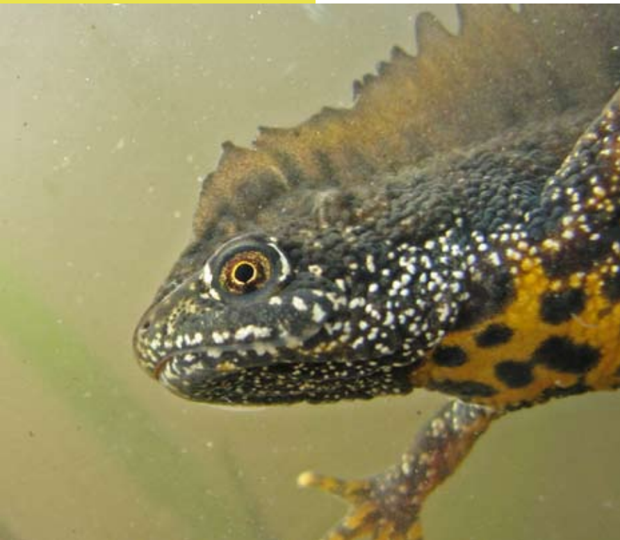
Mannetje kamsalamander