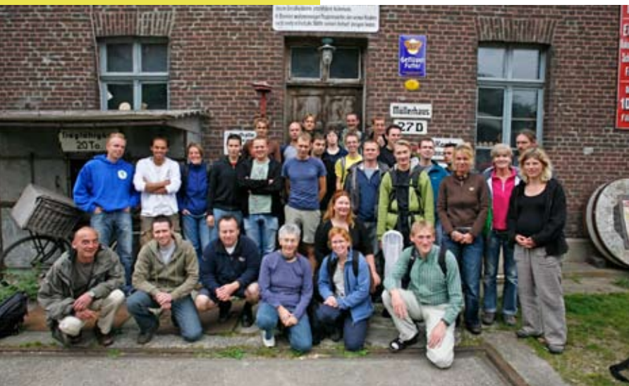
Medewerkers en stagiaires RAVON bij Viler Mühle, Duitsland