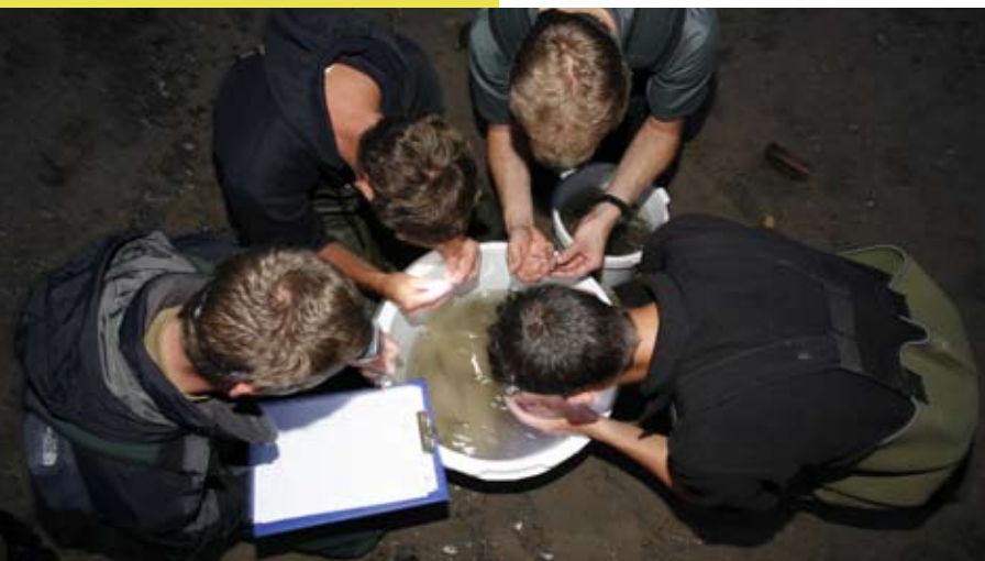
Gelderse vissers 's nachts in actie Voorkant: rivierdonderpad ( Cottus perifretum )

Om onze vrijwilligers nog beter van dienst te zijn is een plan opgesteld gericht op het binden, werven en scholen van vrijwilligers. Ook zijn voorstellen gedaan hoe het contact tussen de beroeps- en vrijwilligersorganisatie verder kan worden verbeterd. RAVON zal zich meer dan voorheen richten op projecten die een breed publiek aanspreken, om zodoende te zorgen voor meer naamsbekendheid en het bereiken van meer potentiële waarnemers. Met behulp van de cursus 'train de trainers' zijn regionaal mensen opgeleid en didactisch geschoold, zodat regionale werkgroepen en provinciale afdelingen zelf cursussen kunnen geven.