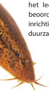
Grote modderkruiper

RAVON heeft onderzoek uitgevoerd naar het voorkomen van de grote modderkruiper in Noord-Brabant en de kwaliteit van zijn leefgebied. Daaruit blijkt dat maar een derde van het leefgebied als voldoende kan worden beoordeeld. Het rapport bevat veel beheer- en inrichtingsmaatregelen, die het behoud van een duurzame populatie mogelijk maken.