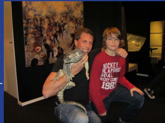
Freek achter de schermen bij DWDD

Freek Vonk was ambassadeur van SOS Vuursalamander en heeft dit actieplan en het 'Jaar van de Vuursalamander' in De Wereld Draait Door en in de TROSKompas onder de aandacht gebracht. Door onder andere Freek Vonk, het adoptieprogramma en social media werd SOS Vuursalamander een succesvol crowdfunding-project. Het opgehaalde bedrag (20.000 euro) kon worden toegevoegd aan de financiering van onderzoek en opvang.