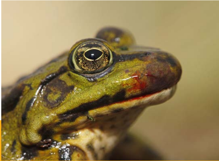
Groene kikker met Ranavirus