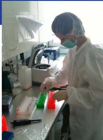
Lab Spygen